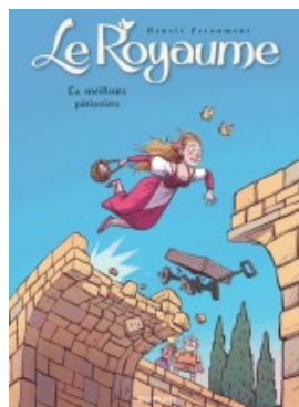
La meilleure pâtissière