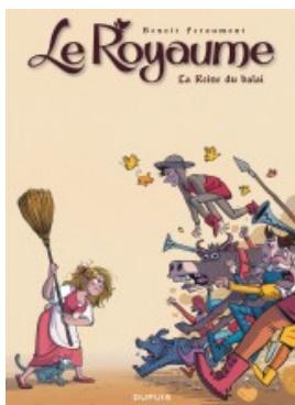
La Reine du balai