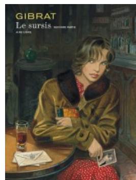
Le Sursis tome 2