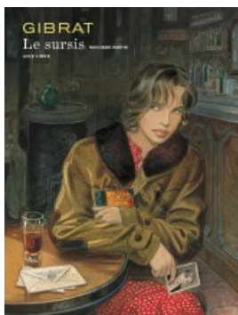
Le Sursis tome 2