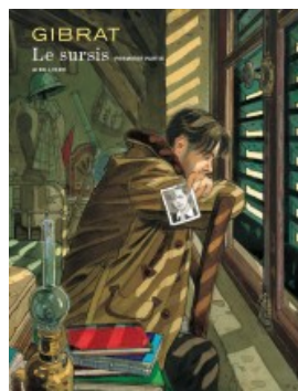
Le Sursis tome 1