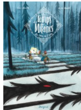
La Peau de l'ours