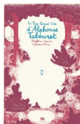
LE TROP GRAND VIDE D'ALPHONSE TABOURET