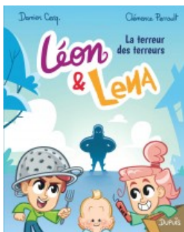
La terreur des terreurs