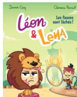
Les fauves sont lâchés