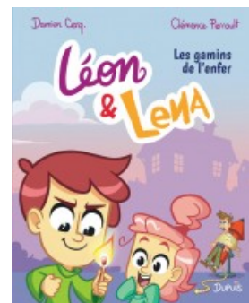
Les gamins de l'enfer