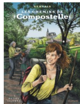
La petite licorne