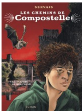
Le vampire de Bretagne