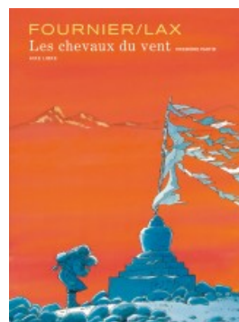
Les chevaux du vent - tome 1