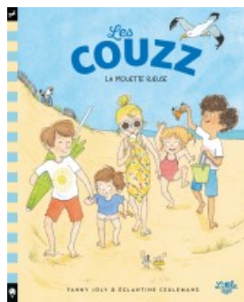
Les Couzz - La Mouette riieuse