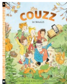
Les Couzz - Six trouilles