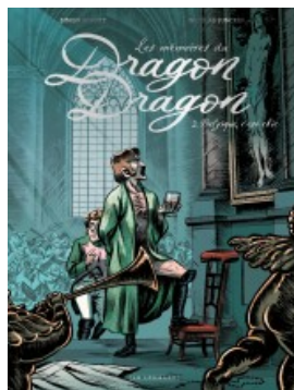
Belgique c'est chic