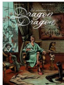
Valmy c'est fini