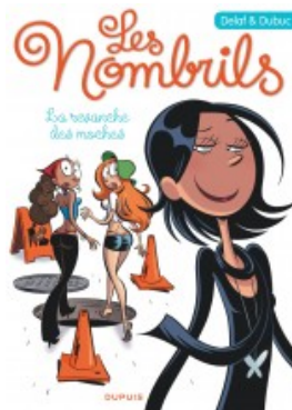
La revanche des moches