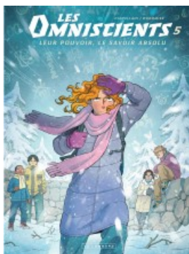
Le second squelette