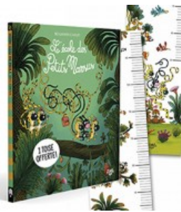
École des Petits Marsus