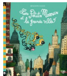
Les Petits Marsus et la grande ville