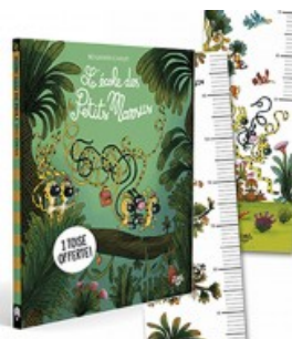
École des Petits Marsus