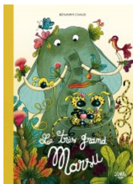
Le très grand Marsu