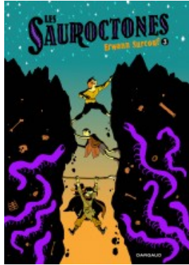
Les Sauroctones - Tome 3