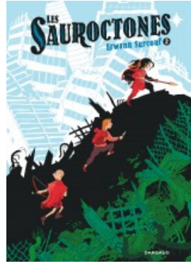
Les Sauroctones - Tome 2