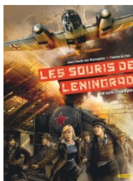
Je suis Chapayev 1/2