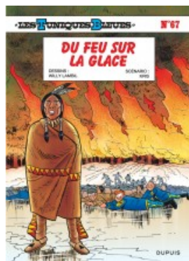
Du feu sur la glace