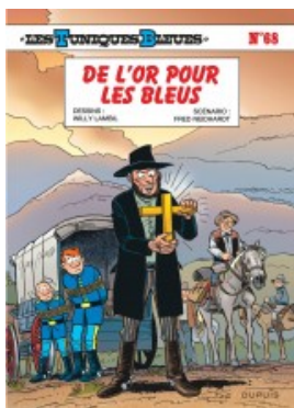
De l'or pour les Bleus