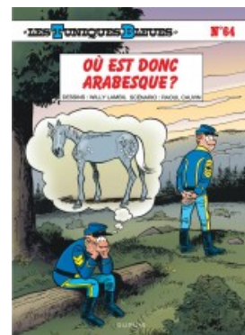
Où est donc Arabesque ?