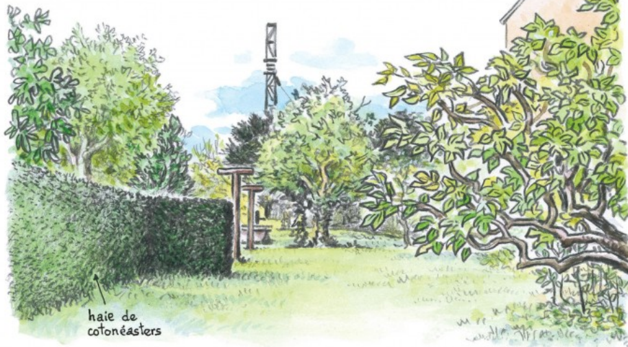
haie de cotonéasters