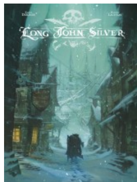
Long John Silver intégrale - tome 1