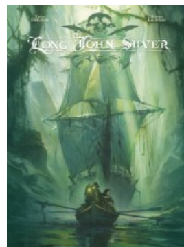
Long John Silver intégrale - tome 2