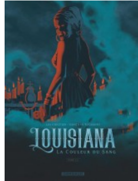
Louisiana la couleur du sang - tome 2