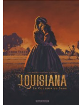
Louisiana tome 1 : la couleur du sang