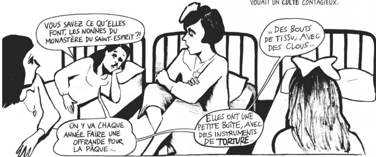
... SES AMIES SE DÉLECTAIENT DE L'HISTOIRE DE LA SAINTE DU MÊME NOM, À LAQUELLE AGATA VOUAIT UN CULTE CONTAGIEUX.