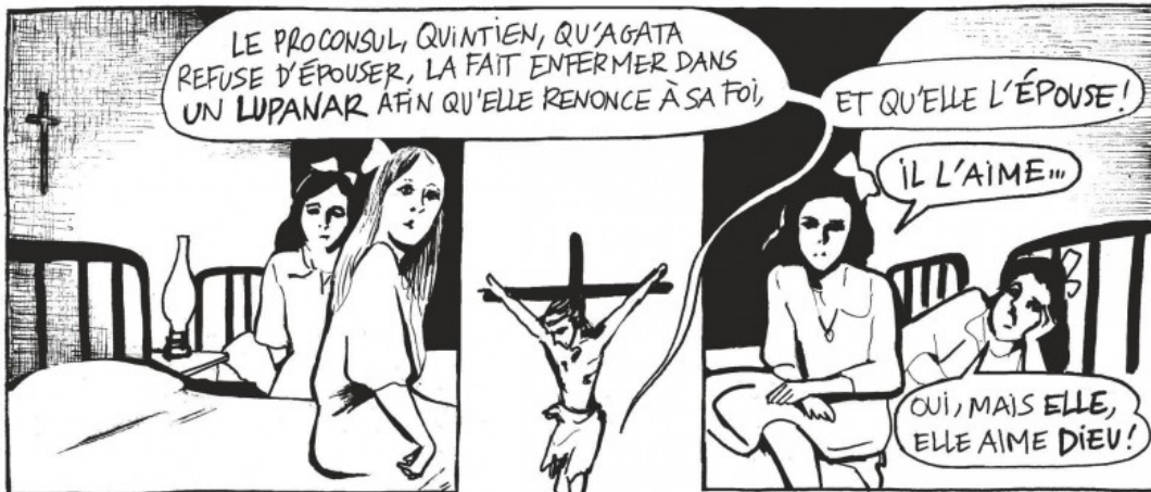
EN ATTENDANT QU'AGATA SE CONFIE SUR SA FAMILLE...