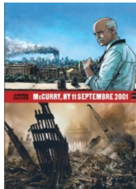
McCurry NY 11 septembre 2001