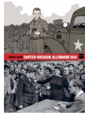
Cartier-Bresson Allemagne 1945