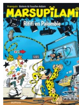
Riffi en Palombie