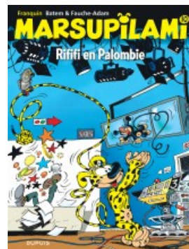
Riffi en Palombie