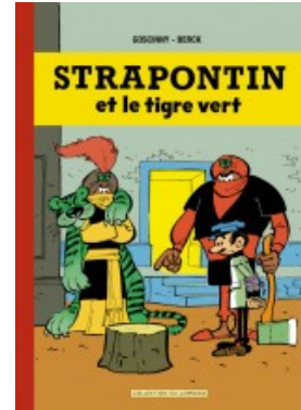
Strapontin - Intégrale