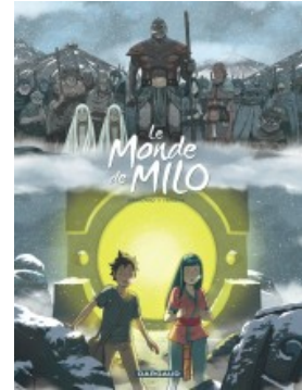
La Terre sans retour - tome 1