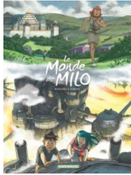
L'Esprit et la Forge - tome 1