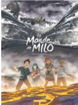
Le Monde Milo - Tome 10