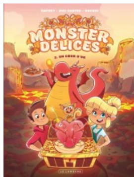
Un coeur d'or