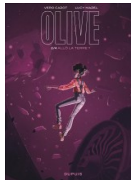
Allô la Terre ?