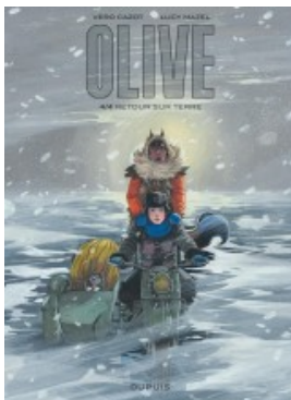
Retour sur terre 4/4