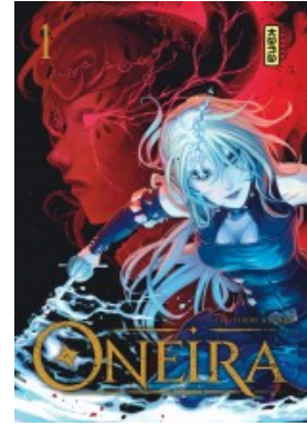
Oneira - tome 1