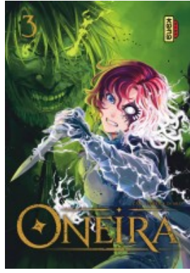
Oneira - tome 3