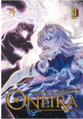
Oneira - tome 4