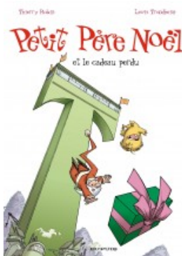
Petit Père Noël et le cadeau perdu