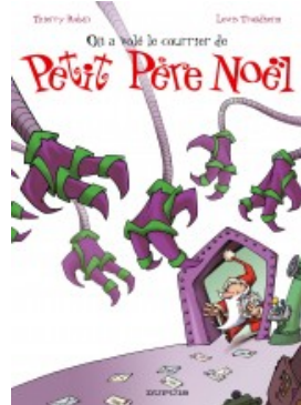
On a volé le courrier de Petit Père Noël