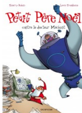
Petit Père Noël contre le docteur Méchant