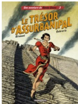
Le trésor d'Assurbanipal