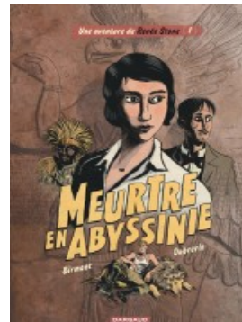
Meurtre en Abyssinie