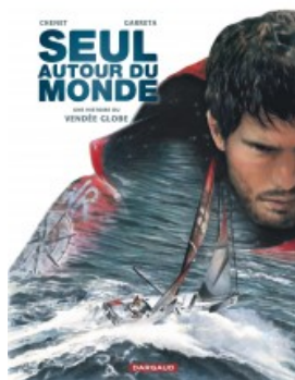
Seul autour du monde