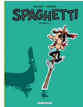
Intégrale Spaghetti 3