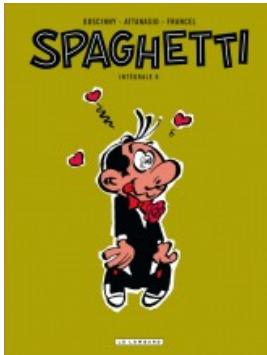
Intégrale Spaghetti 6