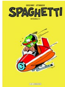
Intégrale Spaghetti 4