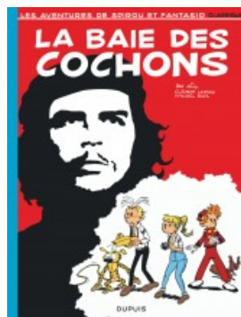
La Baie des cochons