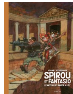
Le groom de Sniper Alley