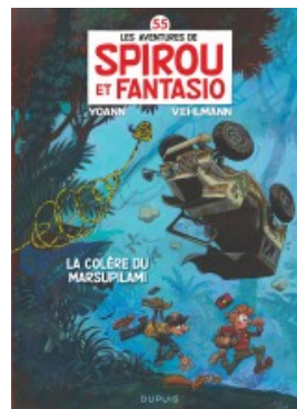
La colère du Marsupilami