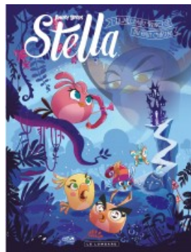
La Méchante princesse du haut château