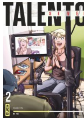
Talento Seven - tome 2