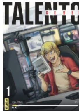
Talento Seven - tome 1