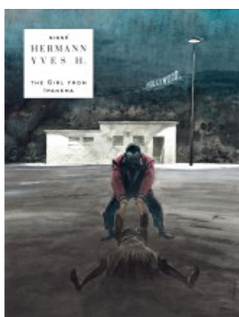
The Girl from Ipanema