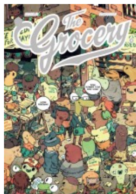
THE GROCERY T04