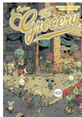
BEFORE THE GROCERY T0