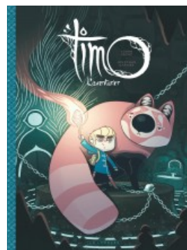
Timo l'Aventurier tome 1