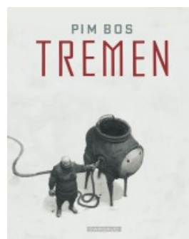
Tremén - tome 1