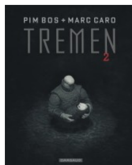
Tremén - tome 2