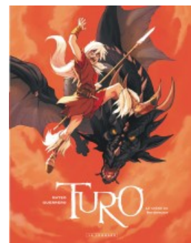
Le Crâne du Roi-Sorcier