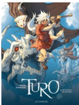
Là où dorment les dragons