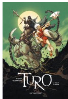
Le Coeur d'Helos