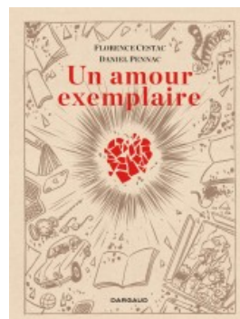
Amour exemplaire (Un)