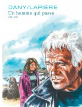
Un homme qui passe