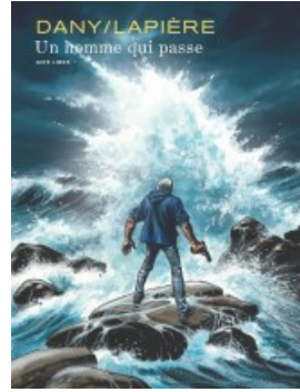
Un homme qui passe