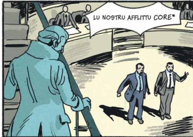
* NOTRE CŒUR AFFLIÉ