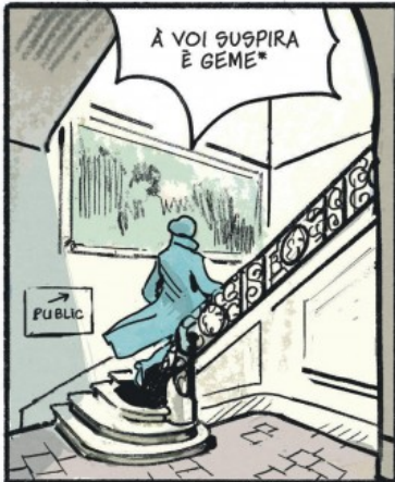
* VERS VOUS SOUPIRE ET GÉMIT