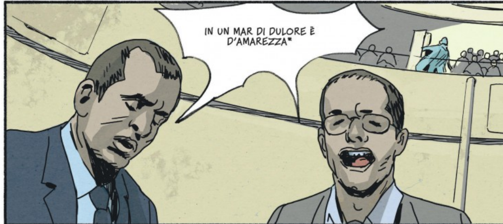
* DANS UNE MER DE DOULEUR ET D'AMERTUME