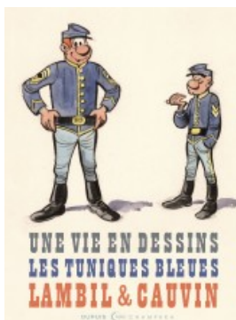
Lambil et Cauvin - Les Tuniques Bleues