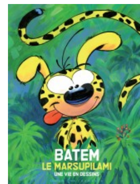
Batem - Le marsupilami