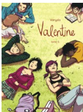
Valentine - tome 6