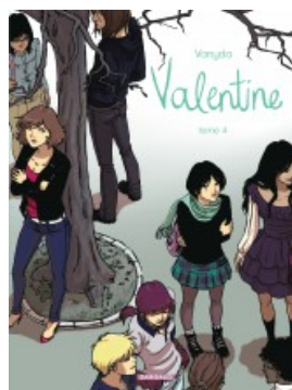
Valentine - tome 4