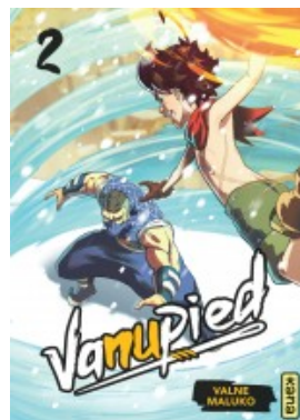
Vanupied - tome 2