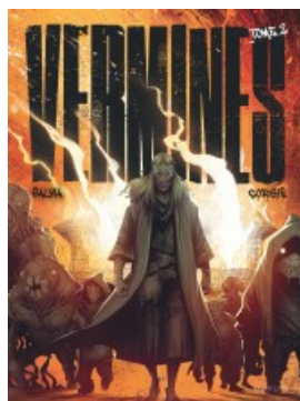
Vermine tome 2