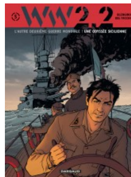
Une odyssée sicilienne