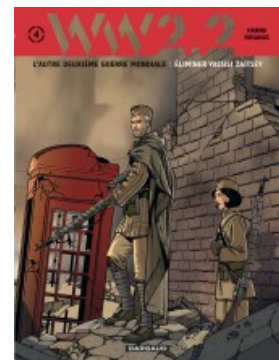
Eliminer Vassili Zaïtsev