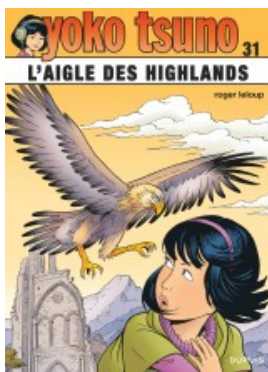
L'aigle des Highlands