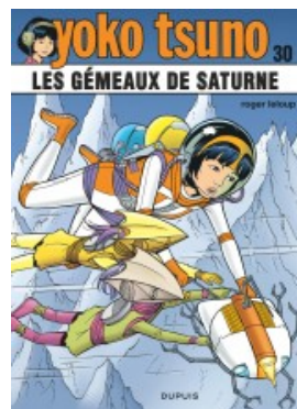
Les gémeaux de saturne