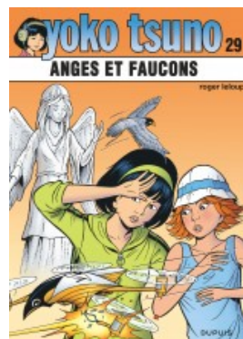
Anges et faucons