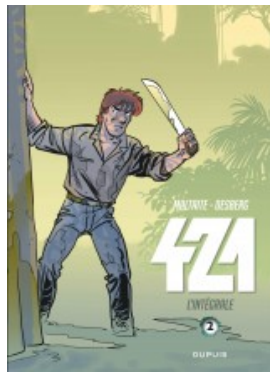
421 - L'intégrale - tome 2