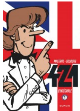
421 - L'intégrale - tome 1