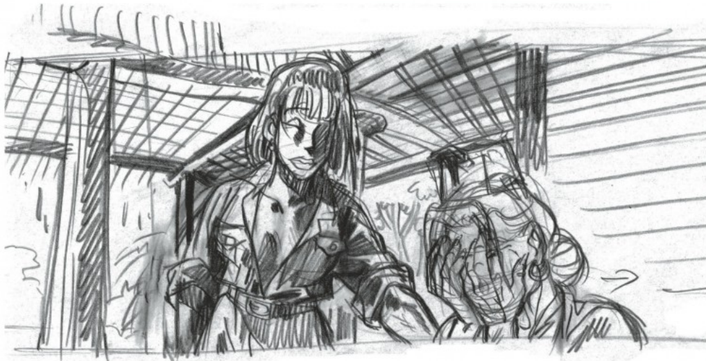
Cases crayonnées pour Les années de brouillard .