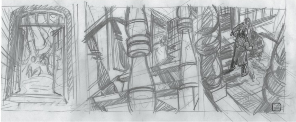
Crayonné du dernier strip de la planche 11 de Morgane Angel .