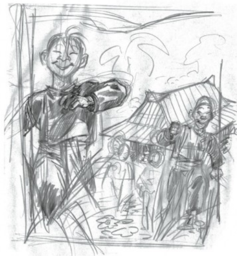
Crayonné de la case 8 de la planche 11 des Années de brouillard .