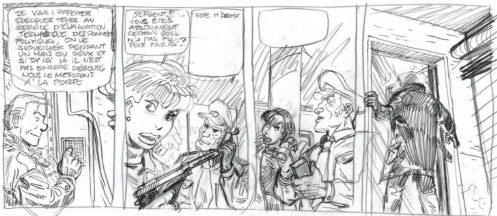
Premier strip de la planche 8 de Morgane Angel . L'espionne prend vite l'ascendant sur 421, un héros assez cliché, imaginé à l'origine comme une parodie de James Bond. La belle Angèle, paradoxalement, lui confère une virilité qui lui manquait un peu...