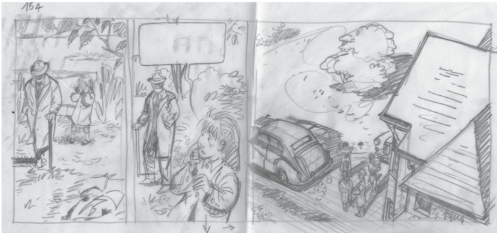
Crayonné du premier strip de la planche 15. Dans Morgane Angel , on découvre le drame qui a affecté l'enfance de Morgane, faisant d'elle une espionne particulièrement retorse. Une façon d'humaniser les personnages, de les rendre plus proches de nous.