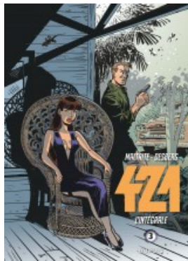
421 - L'intégrale - tome 3