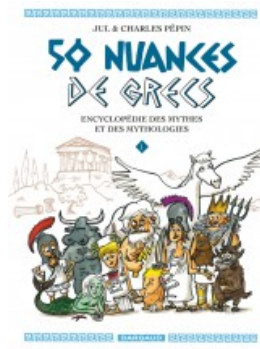
50 nuances de Grecs